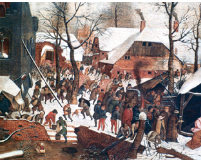
La adoración de los Reyes Magos en la nieve , de Pieter Bruegel, el Viejo (c. 1520-1569). Las expresiones artísticas reflejan, de una u otra manera, los valores de la época en que fueron creadas.