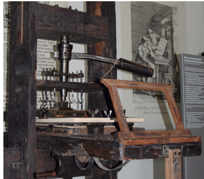
La imprenta cambió la forma de difundir la literatura.