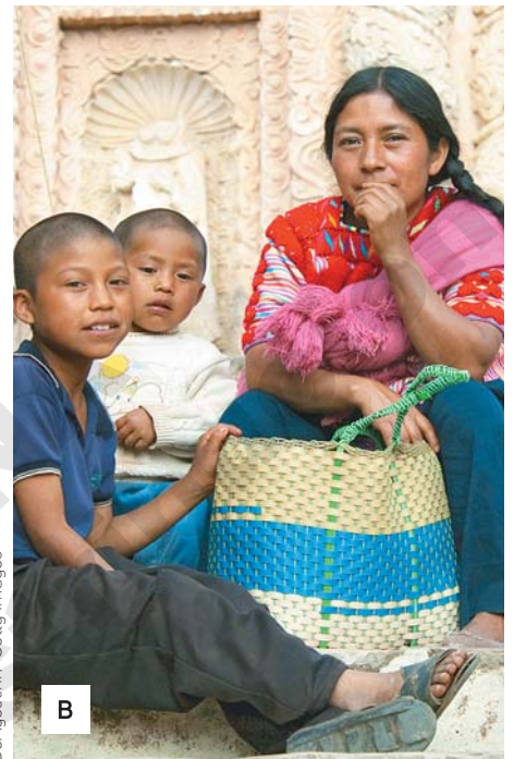
Figura 2.1 (A) Pintura de castas de la época virreinal y (B) indígenas tzotziles, Chiapas, siglo XX.