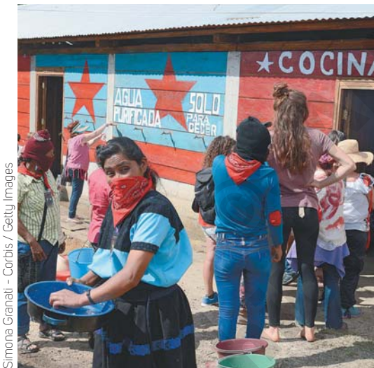
Simona Granati - Corbis / Getty Images