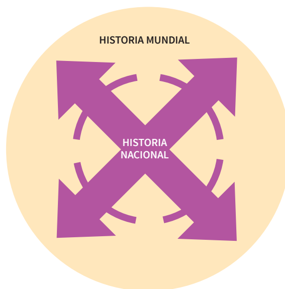
Esquema 1.8 Las relaciones entre la historia mundial y la historia nacional son recíprocas, complementarias y constantes.

La siguiente nota informa sobre la relación entre la historia mundial y la nacional a través de un producto mexicano que es conocido en todo el mundo: www.esant.mx/fasehs2-013 (consulta: 22 de junio de 2018).