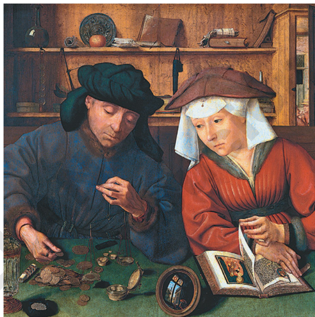
Museo de Louvre, París, Francia

Lo que es importante y debes reconocer es que tanto la historia mundial como la nacional contribuyen a la mejor comprensión de la historia de la humanidad.