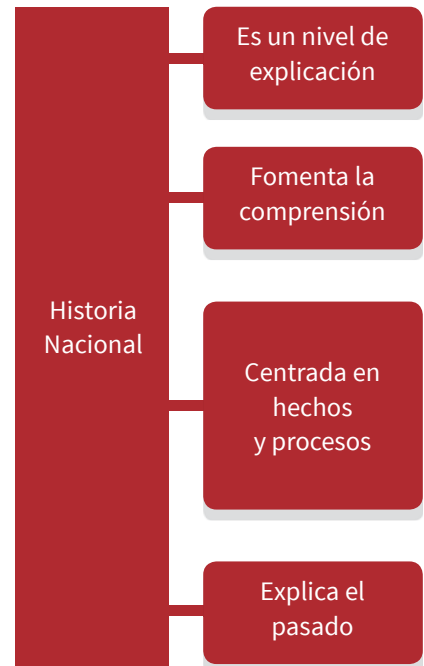
Esquema 1.7 Diferencias entre historia patria e historia nacional.