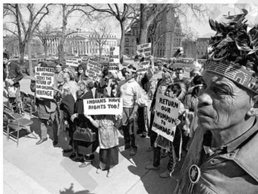
Figura 3.4 Nativos americanos protestan en Nueva York por el respeto a su cultura, 1970.

Desde su fundación, la Organización de las Naciones Unidas ha consagrado en todas sus normas de derechos humanos la prohibición sobre la discriminación racial, encomendando a los Estados obligaciones para suprimirla.