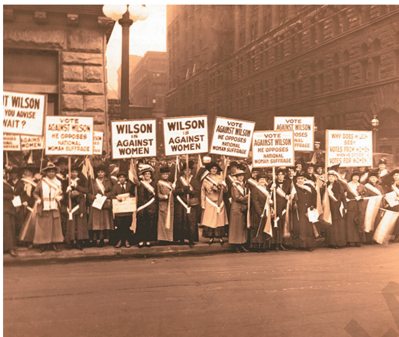
Figura 3.2 Mujeres del movimiento sufragista, EUA, 1916.

Debido a la Revolución industrial, las mujeres y los niños fueron incorporados como mano de obra, pero fueron explotados y se les negaron sus derechos laborales.