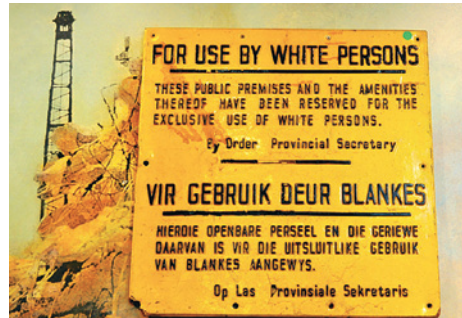
Figura 3.1 Señal que se usaba en espacios públicos de Sudáfrica entre 1948 y 1990.

En parejas, observen el cartel y lean su traducción.