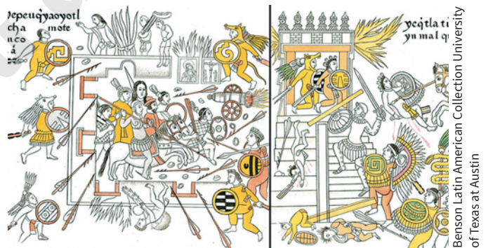
Figura 1.24 Combate entre españoles y mexicas, Lienzo de Tlaxcala, láminas 15 y 16, siglo XVI.

Entender las acciones nos ayuda a explicar hechos como las migraciones, las guerras, los intercambios comerciales, la producción industrial, las revoluciones y los cambios de gobierno, entre otros.