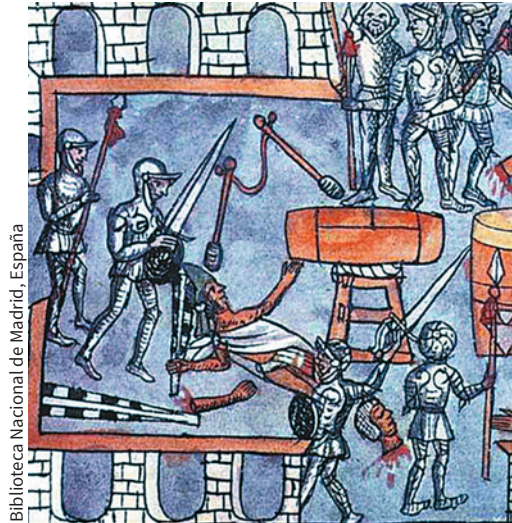
Figura 1.21 Diego Durán, Historia de las Indias de Nueva España , folio 211, siglo XVI.

1. Organizados en parejas, observen las imágenes y respondan.