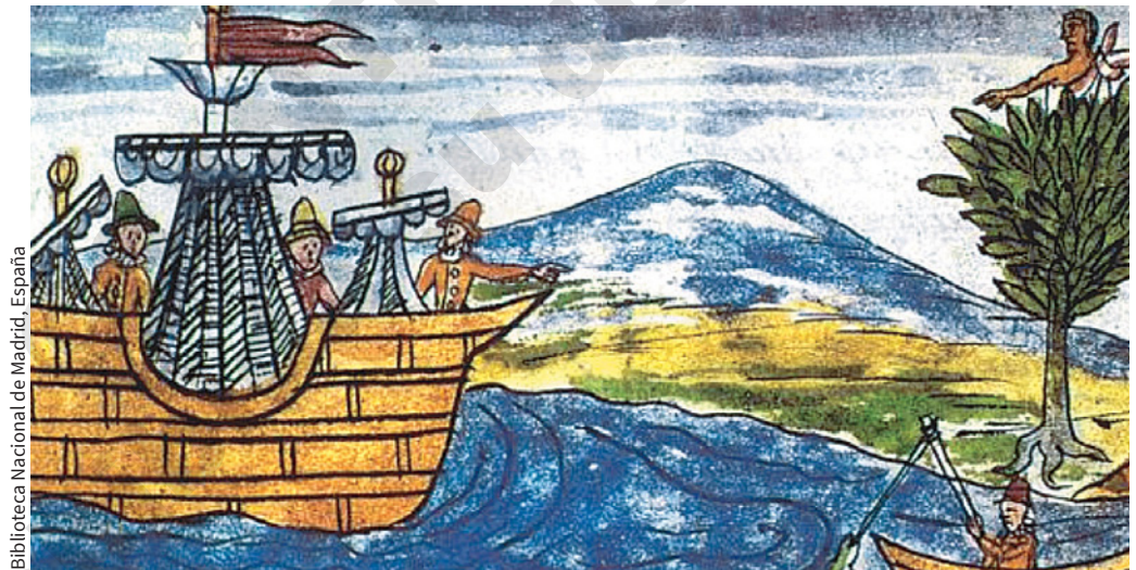
Figura 1.23 Diego Durán, Historia de las Indias de Nueva España , folio 197, siglo XVI.