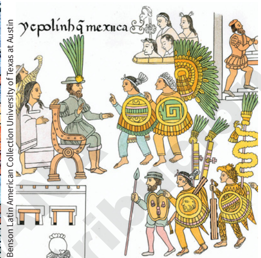
Figura 1.22 Lienzo de Tlaxcala, lámina 48, siglo XVI.