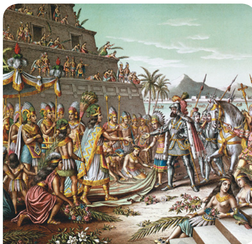
Figura 1.11 Entrada de Cortés en México, litografía coloreada, anónima, publicada en 1892.

En efecto, si consideramos la conquista de México podemos observar que ésta no sucedió de un día para otro, sino que fue un proceso largo que resultó de una serie de hechos o acontecimientos previos como la llegada de Hernán Cortés y otros conquistadores españoles a tierras mesoamericanas en 1519, su alianza con grupos indígenas que estaban sometidos por los mexicas, su objetivo de conquistar el Imperio mexica, el deseo de enriquecerse, entre otros factores.