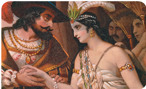
Figura 1.10 Hernán Cortés y doña Marina, litografía coloreada del siglo XIX.

El término “malinchismo” se usa para referirse a la preferencia de algunas personas por productos procedentes del extranjero sobre los mexicanos. Se originó en la historia de La Malinche quién ayudó a los españoles como intérprete.