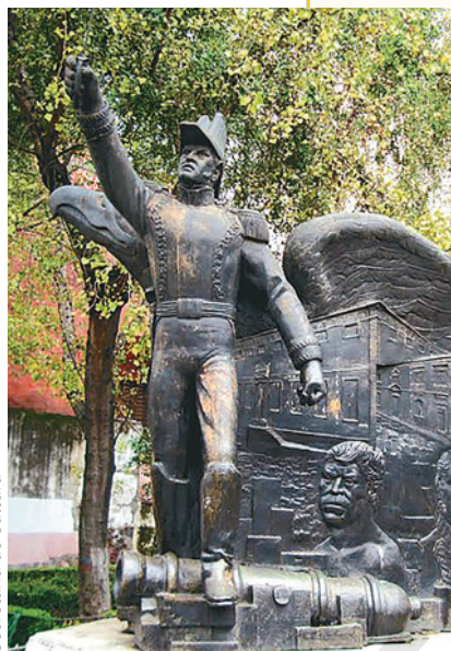
Coordinación Nacional de Monumentos Históricos, INAH, Secretaría de Cultura