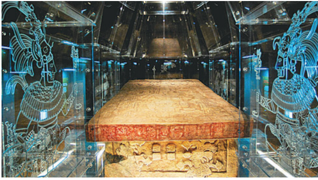
Figura 1.19 Los estudios sobre la tumba de Pakal son un ejemplo de trabajo histórico multidisciplinario e interdisciplinario. Reproducción de la tumba de Pakal, Palenque, siglo VII d.C.

en datos históricos e interpretó los glifos mayas escritos en piedra. Este es un ejemplo de explicación interdisciplinaria (figura 1.19).