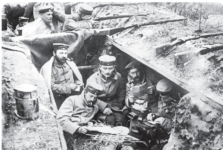
Figura 2.27 Soldados alemanes posan para una fotografía en una trinchera del frente Occidental (Bélgica) en 1916.

Ante el fracaso de la guerra de movimientos o relámpago se inició una segunda fase conocida como guerra de trincheras, que se llevó a cabo entre 1915 y 1917 y fue la más sangrienta, pues se basó en una estrategia novedosa: inmovilizar a los soldados en las trincheras o zanjas que se excavaban a lo largo de varios kilómetros para protegerlos del fuego enemigo (figura 2.27).