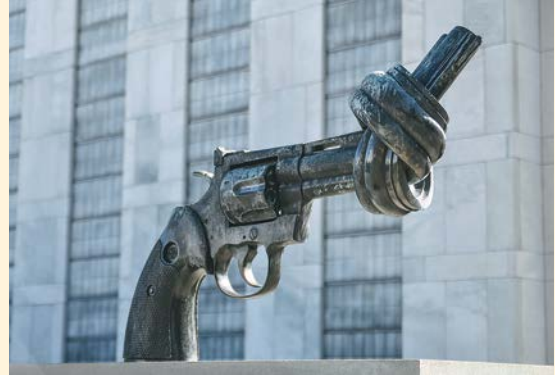
Reutersward, Fredrik. No violencia , Naciones Unidas, Nueva York.