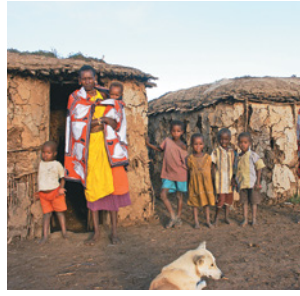
Niños de Bamako, Malí.