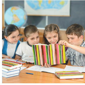
Niños de Glasgow, Reino Unido.