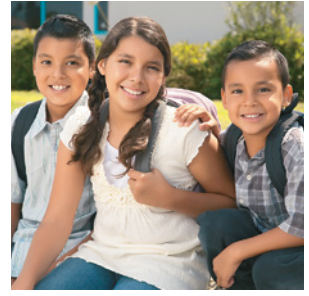
Niños de Pahuatlán, Puebla, México.

a) ¿Cómo piensas que son los ingresos de las familias de esos niños?