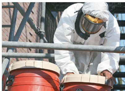
Central nuclear de Hessen, Alemania.