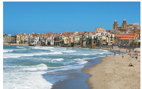
Costa de California, EUA.