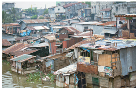
Río Mekong, Camboya.