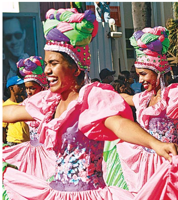
Grabado del siglo XVI en el que se ven esclavos africanos trabajando en el cultivo de caña de azúcar (izquierda), y población actual de República Dominicana que muestra sus tradiciones y costumbres (derecha).