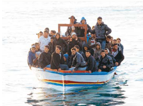
Migrantes de Oriente Medio arriban al puerto de Lampedusa, Italia.