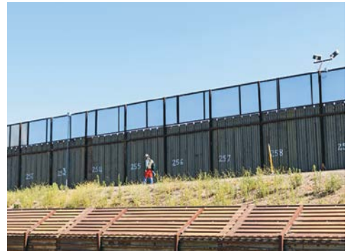
Valla fronteriza México-EUA, en Tijuana, Baja California.