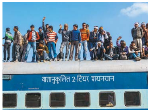
Migrantes en el techo de un tren de pasajeros en Jaisalmer, al noroeste de India.