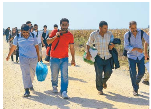
Refugiados sirios llegan a Croacia tras huir de la guerra en su país.