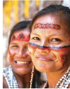
Mujeres nativas del Amazonas, Brasil.