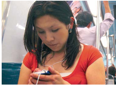
Hoy día, en casi en todo el mundo se comparten valores culturales asociados al consumismo y promovidos por las grandes corporaciones internacionales.