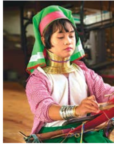
Mujer padaung del norte de Tailandia.