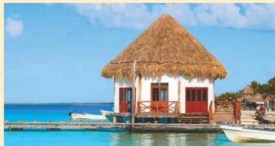
Isla de Holbox, Quintana Roo.

beneficiada, pero, a cambio, la sobredemanda de servicios turísticos se ha traducido en escasez de agua, largas filas para viajar en barco o en taxi, generación de residuos y altos niveles de ruido.