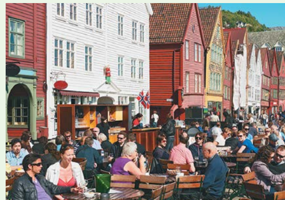
Bergen, Noruega. La población noruega se considera una de las más satisfechas de entre las que conforman los países de la OCDE.

El deterioro del medioambiente es un conjunto de daños y afectaciones al suelo, el agua, el aire y la biodiversidad del entorno natural, como la deforestación y la desertificación; la contaminación del suelo generada por el desecho de basura, insecticidas y fertilizantes; la desecación de cuerpos de agua, el vertido de aguas residuales y derrames de petróleo a ríos, lagos y océanos; el aumento de gases tóxicos y de efecto invernadero en la atmósfera como consecuencia de nuestras actividades diarias, productivas e industriales, y la caza furtiva de especies en peligro de extinción, por mencionar algunos ejemplos.