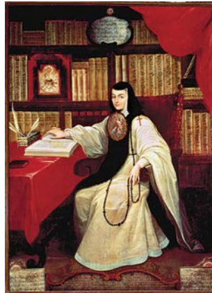
Sor Juana Inés de la Cruz (1648-1695)